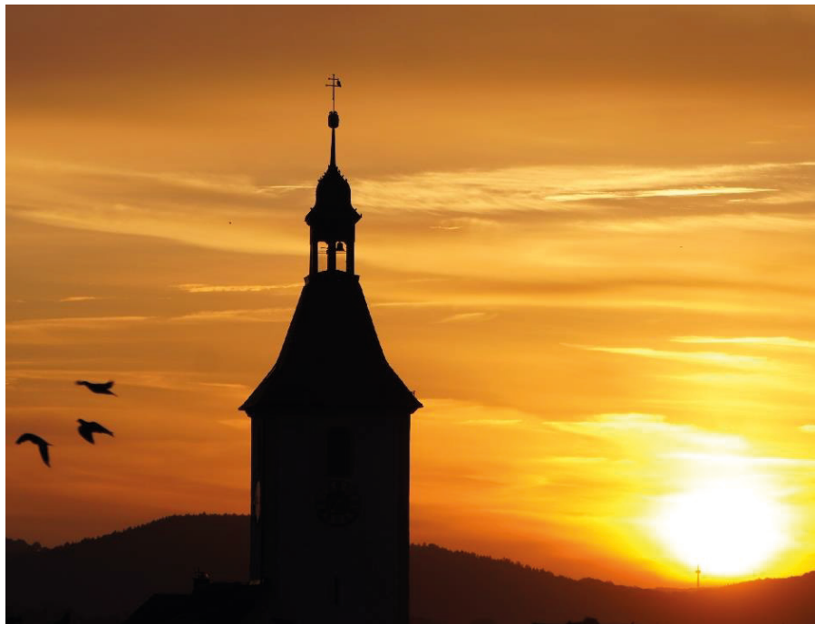
Kirchturm mit Sonnenaufgang am 21.09.2023