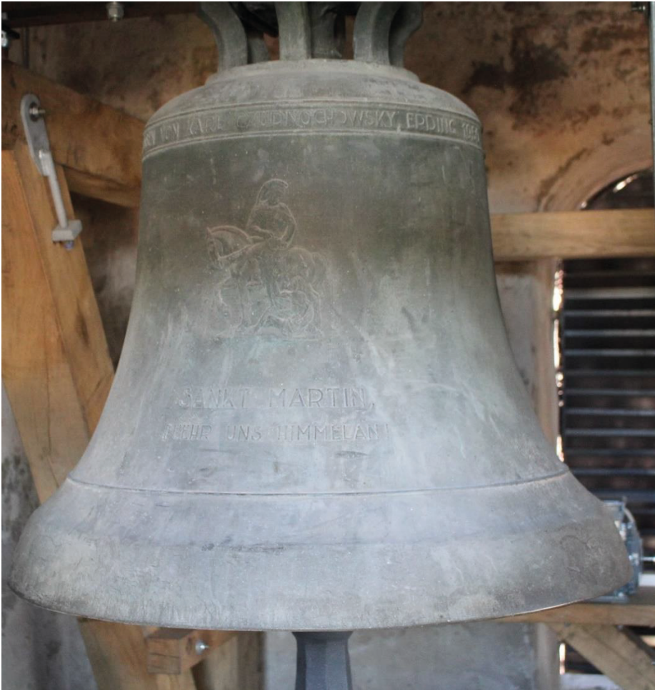
Glocke: St. Martin in der Pfarrkirche Meckenhausen

und Rückblick auf die Meckenhausener Kerwa 2022